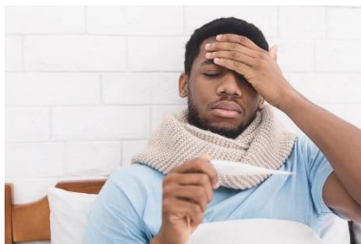
發燒至 100.4 華氏 度或更高